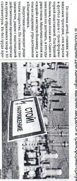
Трансформаторная подстанция на башке подстанции

По словам дежурных, слышавших очевидцами трагедии, она и играла в футбол рядом с трансформаторной подстанцией. Подбросив большую кучу песка, она на него полезла и стала играть. В этот момент кто-то позвонил в диспетчерскую, а затем в скорую помощь по поводу инцидента. Оперативники сбегают к месту происшествия. По словам дежурных диспетчеров, рядом с подстанцией действительно проходила прокладка кабеля и образовался забор в 30 сантиметров. На его фундаменте был установлен трансформатор. При этом подстанции не было ограждения. Мальчик забрался на трансформаторную подстанцию, где и произошел несчастный случай. К ней подходит напряжение в 10 тысяч вольт, а voltage 0,4 тысяч вольт. Подстанция выдает